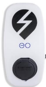
EO Genius Polnilna postaja