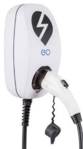
EO Basic Polnilna postaja